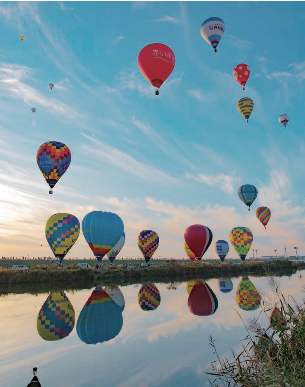
2019佐賀インターナショナルバルーンフェスタ