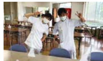
せっとんと古賀さん。 僕から見ても男前です♡

愛車にロッド（釣り竿）を常備し、仕事終わりでもお構いなしに、海へ河へと出かけるパワフルな女性です。初心者の方に釣りを教えてくれるとの事で、同行させていただきました。