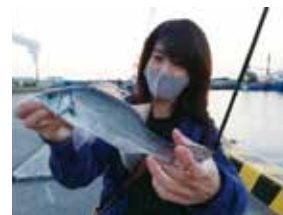
さすが師匠!! お見事です。 何の魚か分かりますか？

マナーを守り、綺麗な海を大切にしましょう!! 3密（密閉、密集、密接）を避け楽しみましょう!!