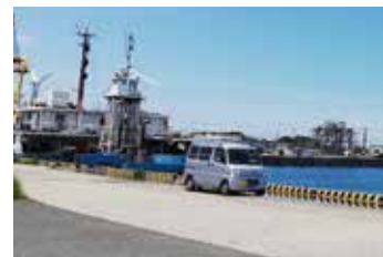
若松白鳥フェリー乗り場です。 晴天、絶好の釣り日和です。