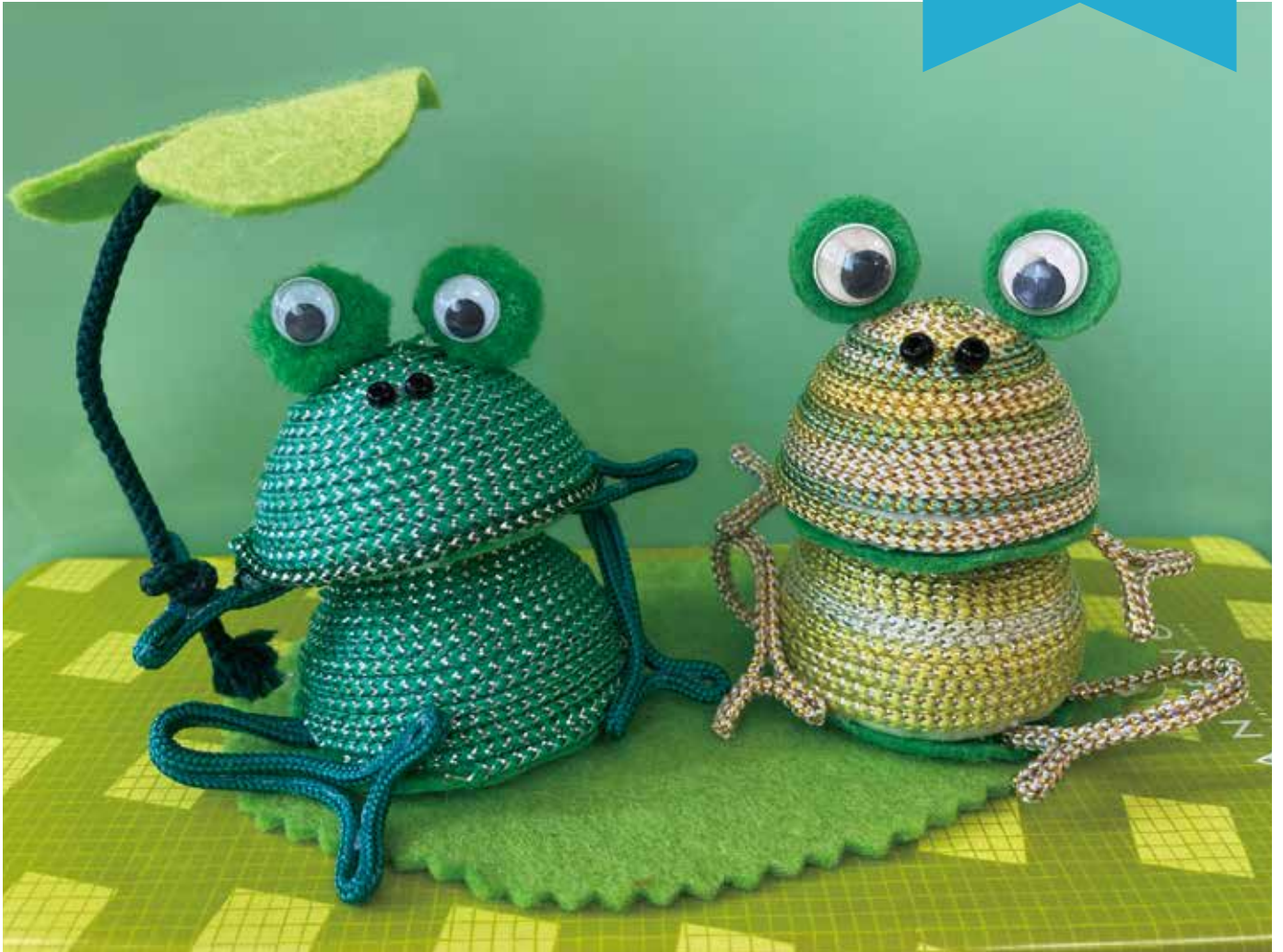
メタリックヤーンアート 作業療法作品