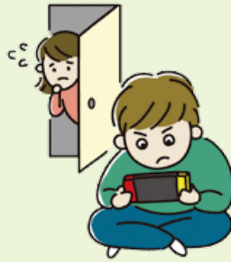
ICD11には「ゲーム障害」が 記載される予定。