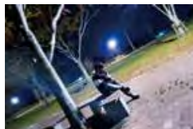
「斜に構え一人黄昏れる、絵になる男」