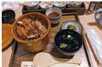
日田まぶし千屋にて昼食