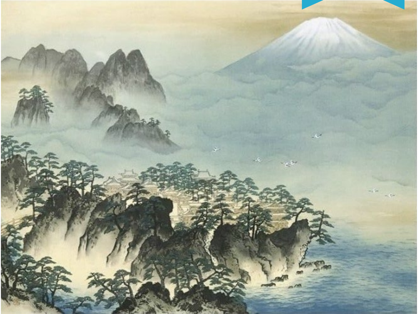
「蓬莱山 横山 大観」こころの杜の美術館